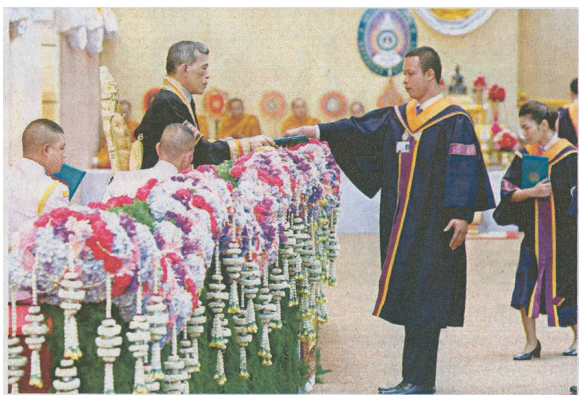
สมเด็จพระบรมโอรสาธิราชฯ สยามมกุฎราชกุมาร เสด็จฯ แทนพระองค์ไปพระราชทานปริญญาบัตรแก่ผู้สำเร็จการศึกษาจากมหาวิทยาลัยราชภัฏบุรีรัมย์ และมหาวิทยาลัยราชภัฏสุรินทร์ ประจำปีการศึกษา 2556-2557 ณ หอประชุมมหาวิทยาลัยราชภัฏสกลนคร อำเภอเมือง จังหวัดสกลนคร

“เดลินิวส์” หน้า ๕ วันพุธที่ ๑๑ พฤศจิกายน พ.ศ. ๒๕๕๘