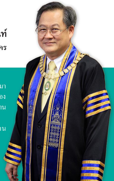
รองศาสตราจารย์ ดร.ชนินทร์ เวสีนนท์ อธิการบดีมหาวิทยาลัยราชภัฏสกลนคร

ขอแสดงความยินดีกับบัณฑิต มหาบัณฑิต และดุษฎีบัณฑิตทุกท่าน การที่ทุกท่านก้าวมาถึงวันนี้ได้ แสดงถึงความมุ่งมั่นทุ่มเทในการพัฒนาความรู้ความสามารถของตนเองอย่างสูงยิ่ง ต้องฟันฝ่าอุปสรรคอย่างมากมาย สิ่งต่างๆ ที่ผ่านมาขอให้เป็นที่พึงเรียนที่ทรงคุณค่าสำหรับการทำงาน และการดำเนินชีวิตที่งดงาม เป็นที่พึงของสังคมได้อย่างมีศักดิ์ศรี มีความมั่นคงและยั่งยืนสืบไป