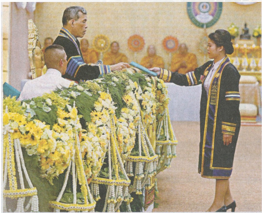
สมเด็จพระบรมโอรสาธิราชฯ สยามมกุฎราชกุมาร เสด็จฯ แทนพระองค์ไปพระราชทานปริญญาบัตรแก่ผู้สำเร็จการศึกษาจากมหาวิทยาลัยราชภัฏสกลนคร และมหาวิทยาลัยราชภัฏอุตรดิตถ์ ประจำปี 2556-2557 ณ หอประชุมมหาวิทยาลัยราชภัฏสกลนคร

“ไทยรัฐ” หน้า ๔ วันอังคารที่ ๑๐ พฤศจิกายน พ.ศ. ๒๕๕๘