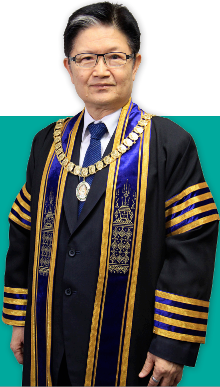
ศาสตราจารย์ ดร.สุภมาศ พนิชศักดิ์พัฒนา นายกสภามหาวิทยาลัยราชภัฏสกลนคร

ขอแสดงความยินดีกับบัณฑิต มหาบัณฑิต และดุษฎีบัณฑิตทุกท่าน ความมุ่งมั่นและอดทนอันยาวนานได้ผลิตดอกออกผลบนเส้นทางเกียรติยศนี้ ซึ่งผู้สำเร็จการศึกษาทุกคนควรจะได้รับบัณฑิตรุ่นนี้ สำเร็จการศึกษาในห้วงที่ประเทศชาติตกอยู่ในภาวะลำบาก ประเทศชาติต้องการสัมมาทิว และต้องการแรงผลักดันแทบทุกด้าน โดยเฉพาะอย่างยิ่งด้านวิชาการ ด้านสังคม และด้านความสามัคคีสามัคคีกัน ทุกท่านที่สำเร็จการศึกษาในรุ่นนี้จึงเป็นความหวังของชาติในการเข้าไปมีส่วนร่วมผลักดันแก้ไขปัญหาดังกล่าวของประเทศ