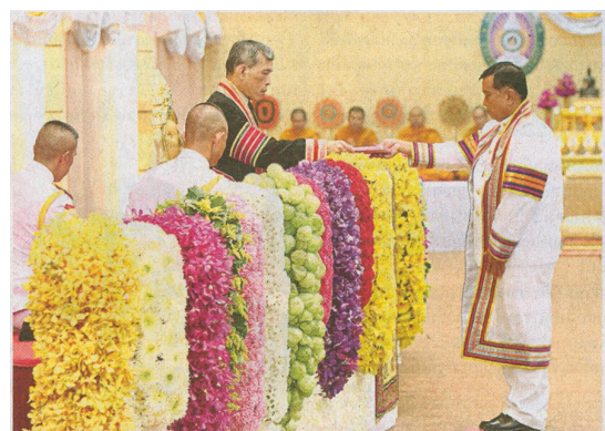
พระบาทสมเด็จพระเจ้าอยู่หัว ทรงพระกรุณาโปรดเกล้าฯ ให้ สมเด็จพระบรมโอรสาธิราชฯ สยามมกุฎราชกุมาร เสด็จฯ แทนพระองค์ไปพระราชทานปริญญาบัตรแก่ผู้สำเร็จการศึกษา จากมหาวิทยาลัยราชภัฏชัยภูมิ และมหาวิทยาลัยราชภัฏอุบลราชธานี ประจำปีการศึกษา 2556-2557 ณ หอประชุมมหาวิทยาลัยราชภัฏสกลนคร จ.สกลนคร

“เดลินิวส์” หน้า ๕ วันพฤหัสบดีที่ ๑๒ พฤศจิกายน พ.ศ. ๒๕๕๘